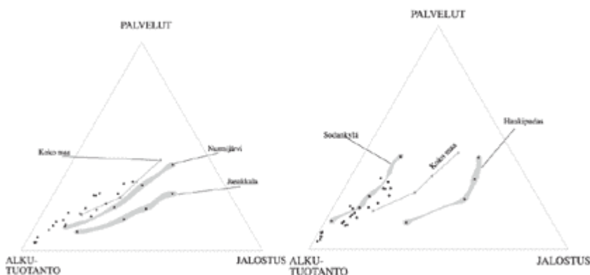
KUVA 3. Tutkimuskuntien elinkeinorakenteen muutos vuosina 1940–1970 alkutuotannon, jalostuksen ja palvelujen keskinäisen prosenttijakauman mukaan.

Toisen maailmansodan jälkeinen asutus- ja uudisraivaustoiminta tulee myös tutkimuskuntien tarkastelussa selvästi esiin. Maatilojen lukumäärä kasvoi suhteellisesti tarkasteltuna eniten Janakkalassa, jonne siirtoväkeä asutettiin huomattavan paljon. Myös kaikissa muissa tutkimuskunnissa tilojen lukumäärä lisääntyi toisen maailmansodan jälkeen, mutta jo 1950-luvulla määrä alkoi lllomantsia, Hyrynsalmea ja Sodankylää lukuun ottamatta vähentyä. Myös peltoalan kasvun suhteen juuri nämä kunnat erottuvat selvästi muista, sillä maan länsiosassa uudisraivaukseen soveltuva ala oli jo suhteellisen vähäinen, kun taas maan itä- ja pohjoisosan tutkimuskunnissa peltoala laajeni edelleen. Kotieläinten lukumäärän kehityksessä alueelliset erot eivät sen sijaan olleet yhtä huomattavia. Kuitenkin 1950-luvulla nimenomaan lllomantsissa, Hyrynsalmella ja Sodankylässä esimerkiksi hevosten lukumäärä pysyi jokseenkin ennallaan ja lehmien lukumäärä puolitoistakertaistui, vaikka muissa tutkimuskunnissa kehitys oli jo toisentyypistä. Myös metsätöiden merkitys oli näissä kunnissa selvästi suurin, joskin myös muissa maan keski-, itä- ja pohjoisosan tutkimuskunnissa puunkorjuun merkitys oli edelleen tärkeä.