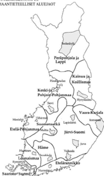
KUVA 1. Suomen maaseudun muutoksen tutkimusohjelman kohdealueet.

Tutkimusalueiden valinnan toisena keskeisenä lähtökohtana oli maaseutupolitiikassa käytetty kuntien jaottelu eri maaseututyyppeihin. Yleisesti vakiintunut jako kaupunkien läheiseen maaseutuun, ydinmaaseutuun ja harvaanasuttuun maaseutuun sekä tämän